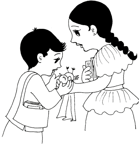
‘මා නිවන්හ අහික්කම’ - නො නැවත ඉදිරියට යවු